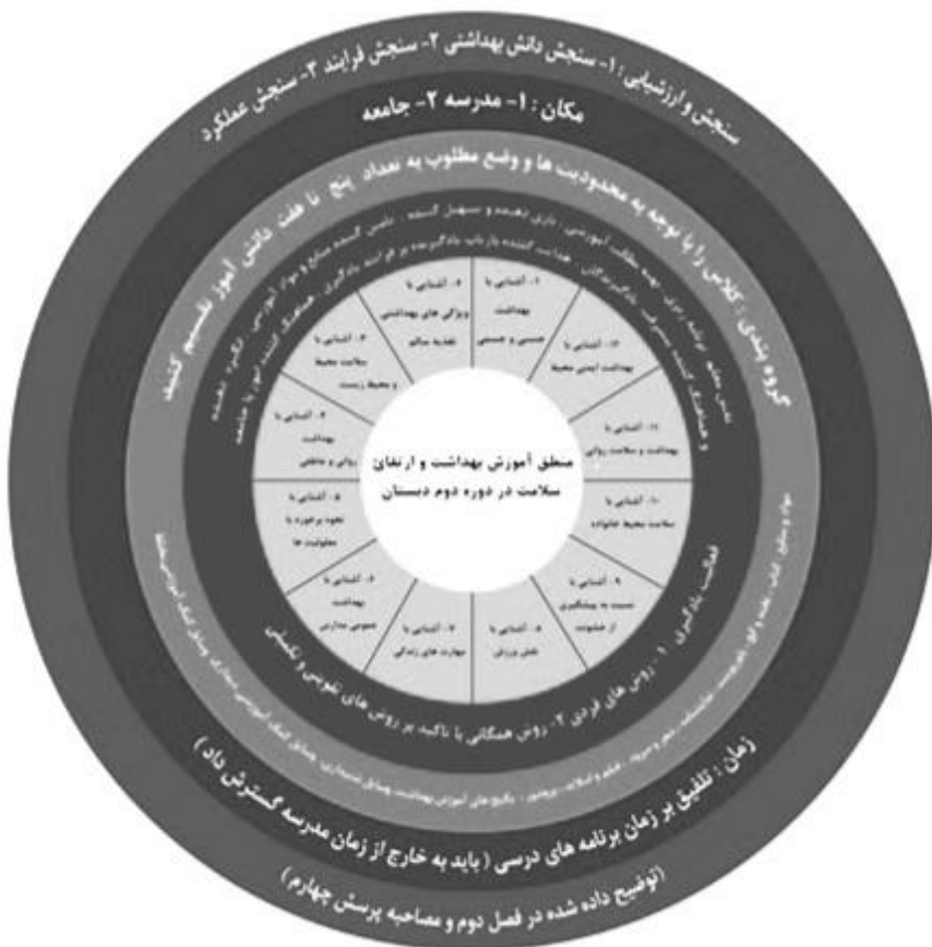
شکل ۲. طراحی الگوی آموزش بهداشت و ارتقای سلامت در دوره دوم دبستان با استفاده از مدل اگر