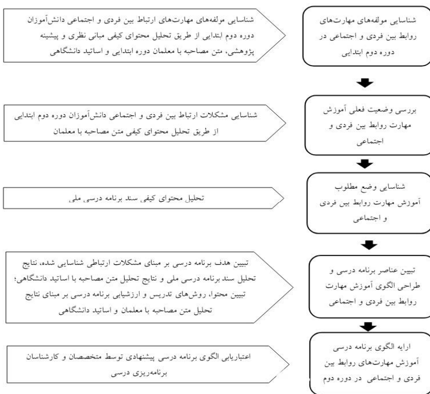
شکل ۱. مراحل پژوهشی و منابع کسب اطلاعات

برای شناسایی مولفه‌های مهارت ارتباطی بین فردی و اجتماعی و نیز شناسایی مشکلات ارتباطی دانش‌آموزان، با معلمان دوره دوم ابتدایی، مصاحبه به عمل آمد. معلمان یکی از نزدیک‌ترین و بهترین اشخاص برای مشاهده رفتارهای اجتماعی دانش‌آموزان در موقعیت‌های مختلف هستند. برای دسترسی به معلمان و کسب اطلاعات از آنها، از روش نمونه‌گیری در دسترس، هدفمند و نظری استفاده شد. به طوری که معلمان دوره دوم ابتدایی که دارای سطح کارشناسی ارشد یا دکتری، فارغ‌التحصیل هر یک از رشته‌های روان‌شناسی و علوم تربیتی و دارای سابقه تدریس بیشتری بودند از طریق اداره آموزش و پرورش مناطق ۱۵، ۱۶ و ۱۹ شهر تهران شناسایی شدند و مصاحبه با آنها تا آنجا صورت گرفت که نمونه بعدی، اطلاعات جدید دیگری در اختیار مصاحبه‌گر قرار ندهد. در مجموع ۲۰ معلم مورد مصاحبه قرار گرفتند. کلیه