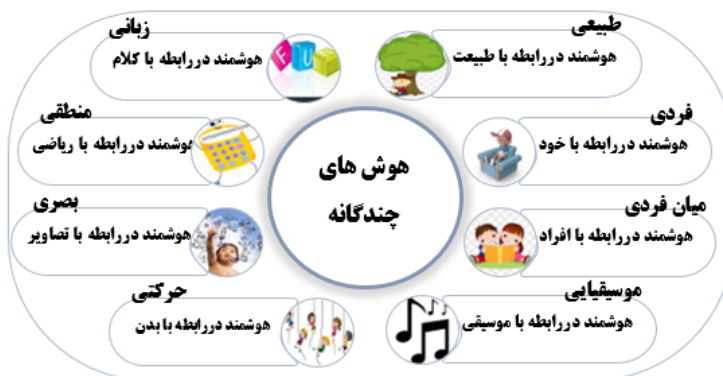
شکل ۱ هوش‌های چندگانه هوارد گاردنر (برگرفته از صدیق و همکاران، ۲۰۲۱)

(لطف آبادی، ۱۳۸۶؛ سیف، ۱۳۹۶). در دیدگاه سنتی، هوش ویژگی ذاتی افراد است و آموزش بر آن تأثیری ندارد (سیف، ۱۳۹۶). در مقابل، در تعاریف مدرن، هوش پدیده‌ای چند بعدی است که سطوح مختلف مغز، ذهن و سیستم بدن انسان را نشان می‌دهد (غریبی و همکاران، ۱۳۹۷؛ حاج هاشمی و همکاران، ۲۰۱۳) و باعث وجود روش‌های چندگانه و در عین حال منحصر به فرد در دریافت، پردازش و بازنمایی اطلاعات در موقعیت‌های مختلف برای افراد می‌شود (نوری، ۱۳۹۳). مهم‌ترین پیامد نظریه گاردنر؛ از نظریه پردازان معاصر، تک بعدی نبودن پدیده هوش است (مهرمحمدی، ۱۳۹۱). به باور وی، یک فرد دارای هوش‌های متفاوت یا نیمی‌رخ‌ی از بهره هوشی است که قابل تقویت هستند (گاردنر، ۱۹۸۳). این نیم‌رخ بهره هوشی را می‌توان به صورت شکل ۱ خلاصه کرد: