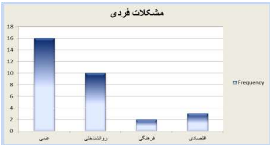
نمودار ۲. بسامد هر یک از انواع مشکلات فردی در پاسخ‌های معلمان

انواع مشکلات فردی (نمودار ۲) و مشکلات آموزشی (نمودار ۳) ترسیم گردید. نگاهی به نمودارهای میله‌ای مشکلات فردی و آموزشی بوضوح نشان می‌دهد که در وهله اول تعداد مشکلات آموزشی که شامل ۶ مورد می‌باشد در مقایسه با مشکلات فردی (۴ مورد) بیشتر است. لذا می‌توان نتیجه گرفت که ریشه معضلات معلمان را باید بیشتر در عوامل آموزشی یافت. همچنین نمودارها بسامد هر یک از مشکلات را در حوزه‌های فردی و محیطی به خوبی نشان می‌دهند.