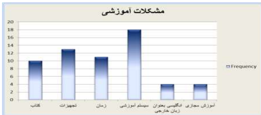
نمودار ۳. بسامد هر یک از انواع مشکلات آموزشی در پاسخ‌های معلمان

در نمودار شماره ۳ بسامد مشکلات مربوط به سیستم آموزشی بالاترین رتبه را به خود اختصاص داده است. در واقع مشکلات مربوط به سیستم آموزشی پربسامدترین معضل در پاسخ‌های معلمان شناخته شد. پس از آن مسئله‌های مربوط به تجهیزات و عدم وجود امکانات آموزشی کافی رتبه دوم را به خود اختصاص داده است و با فاصله کمتری مسئله عدم کافی بودن زمان و همچنین محتوای کتب درسی بعنوان پربسامدترین معضلات آموزشی در رتبه‌های سوم و چهارم قرار گرفتند. در نهایت، با فاصله نسبتاً زیادی از سایر مشکلات محیطی، دو معضل مربوط به آموزش مجازی و انگلیسی به عنوان زبان خارجی با کمترین بسامد در نمودار نشان داده شده‌اند.